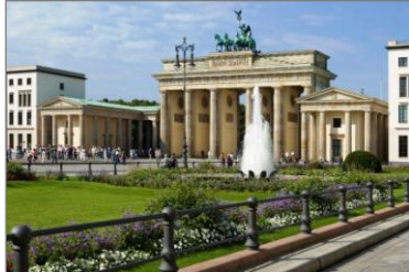
Brandenburger Tor und Pariser Platz