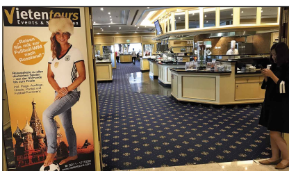
Frühstück mit Gelegenheit zur Sprechstunde am Sonntag in eigenen Vietentours -Bereich mit den Mitarbeitern

Bitte geben Sie bei Buchung an, falls Sie eine Präferenz haben, nahe welcher Fankurve Sie sitzen möchten. Wir können aber keine Versprechungen machen oder Garantien geben.