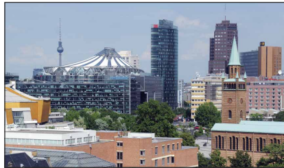
Blick vom Hotel Maritim auf den nahen Potsdamer Platz