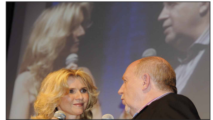
Fußballexperte und TV-Star Reiner Calmund meist dabei

Die Zimmer der Komfort-Kategorie sind auf der 3./4. Etage zum Kulturviertel, geräumig, elegant und bieten Kaffeemaschine. FB-BER4219: 977€ pro Person im Doppelzimmer, EZ-Zuschlag 198€